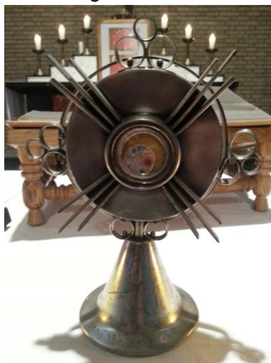
Reliekhouders H.Liduina (koper)

Coördinatoren van Misdienaars, Lectoren, Collectanten, Zangkoren, Onderhoudsgroep en Kerstversiering. Daarnaast vertegenwoordigers